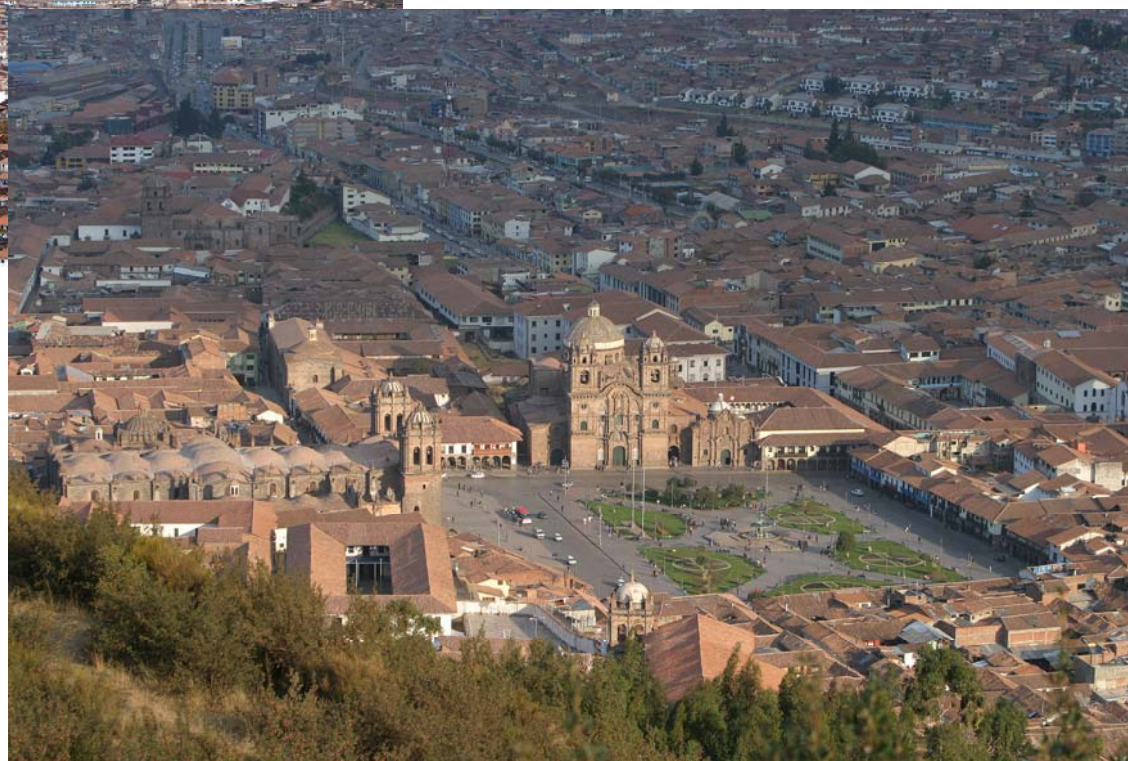
ピューマの頭であるSACSAYHUMAN 遺跡の丘からピューマの形をした街を 見下ろす