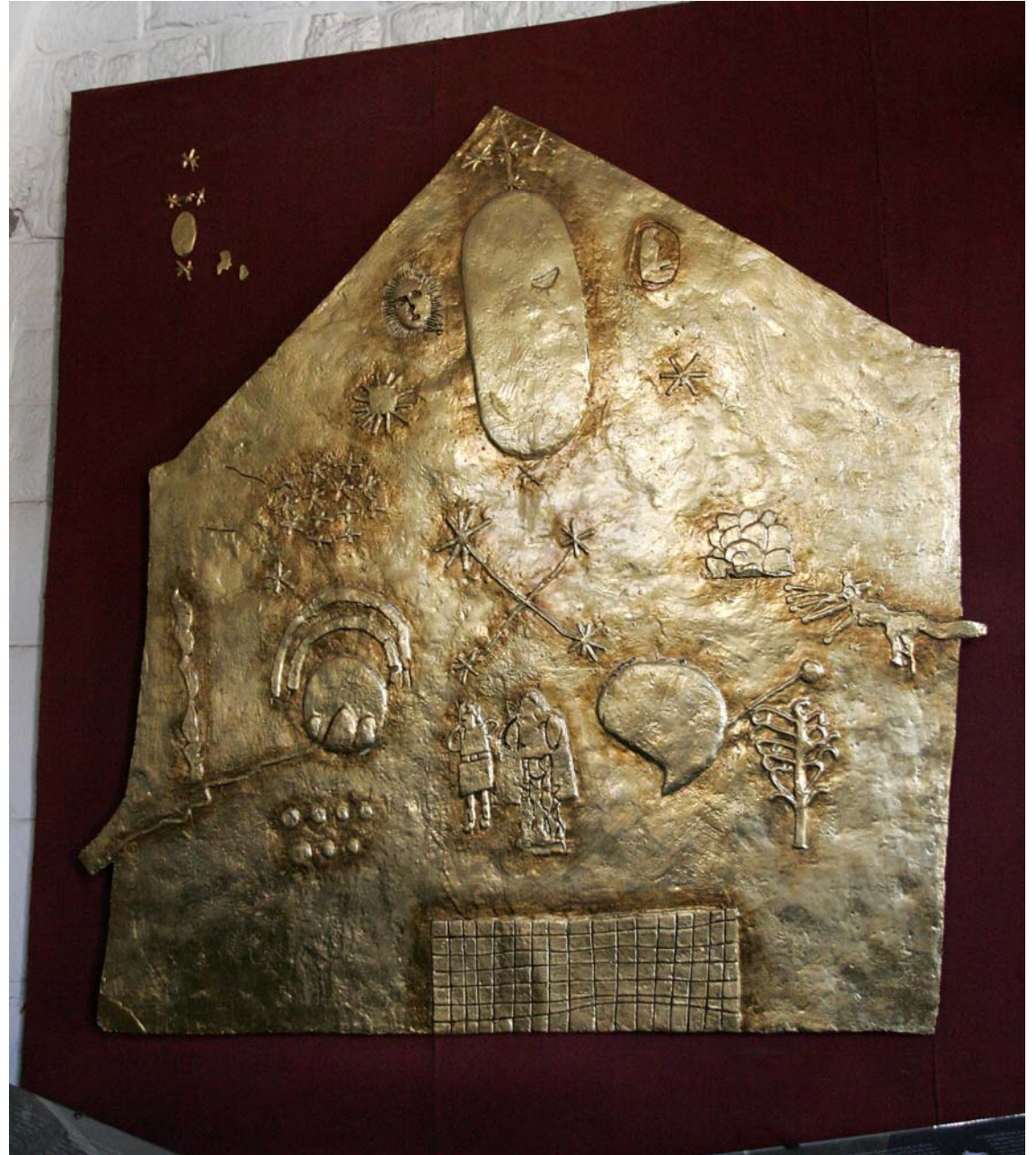
古代インカ人の世界観。太陽、コンドル、ピューマ、蛇。