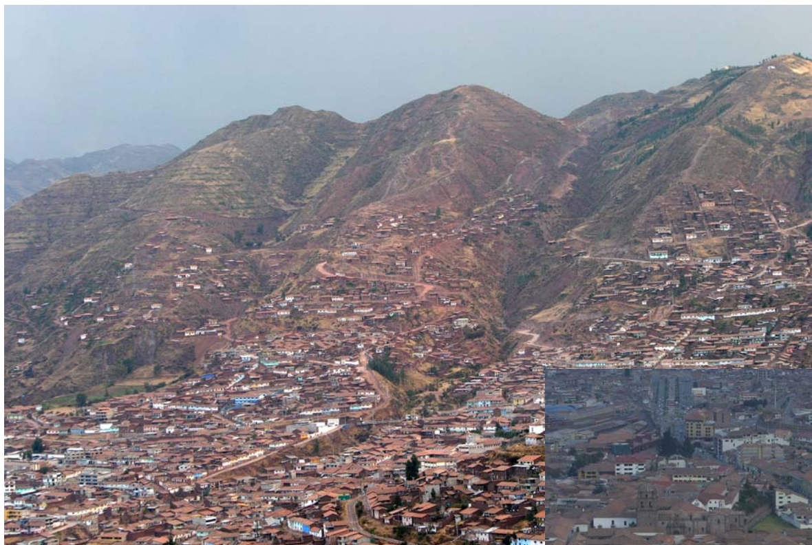
海拔3,400mの盆地クスコ Cuzcoとは臍を表す