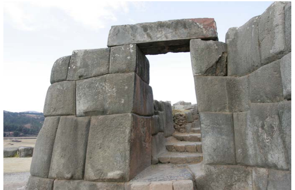
SACSAYHUAMAN遺跡 クスコの街を望む丘。 ピューマの頭。