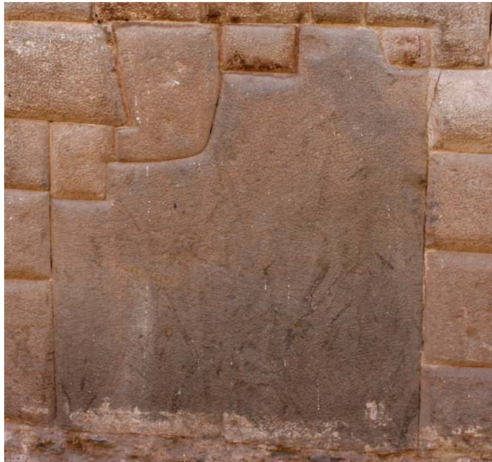
カミソリも通さぬという石積み。